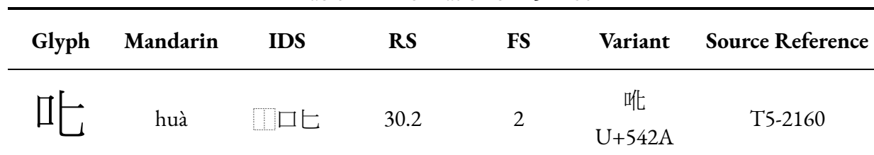
Table 1 Information of T5-2160

By the way, this character can be horizontally extended by G-source as GHZR-20619.05.